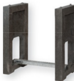
ZEMNÍ ZÁKLADNA / UNDERGROUND BASE